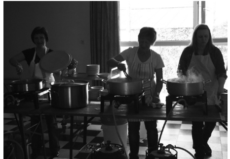
Onze vaste keukenploeg